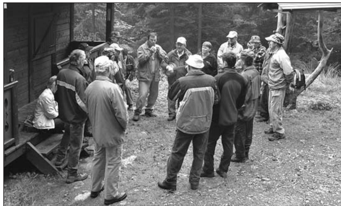
Pri chate na Muzikantskom chodníku sa turisti zastavili a občerstvili.