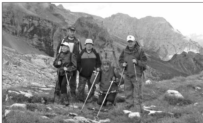
Vlachovskí turisti v Taliansku