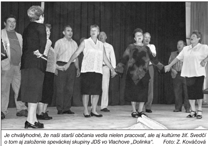
Je chvályhodné, že naši starší občania vedia nielen pracovať, ale aj kultúrne žiť. Svedčí o tom aj založenie speváckej skupiny JDS vo Vlachove „Dolinka“.