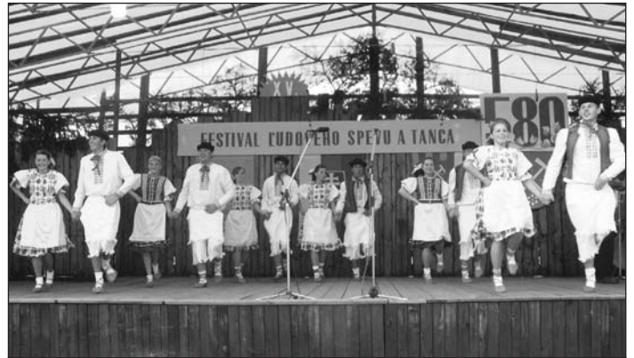
FS Stromiš v programe XV. ročníka Folklórneho festivalu vo Vlachove.