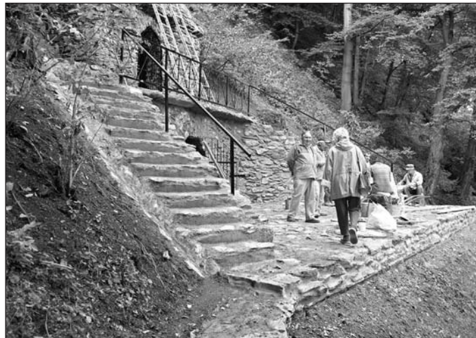
Grófska ľadovňa sa po oprave, vybudovaní mostíka a prístrešku stane atraktívnym oddychovým miestom pre občanov. (Záber z kontrolného dňa).

v príjmovej aj výdavkovej časti. Plnenie k 30.6.2007 je v príjmovej časti 4 078 000,- Sk a vo výdavkovej časti 3 344 000,- Sk. Obec vykazuje nedoplatky na dani z nehnuteľností u fyzických osôb vo výške 15 539,- Sk, dani z nehnuteľností u právnických osôb vo výške 16 761,- Sk, nedoplatky na poplatku za psa 1 600,- Sk a nedoplatky na poplatku za dovoz TKO vo výške 17 823,- Sk. Na účtoch obce je 1 398 741,- Sk a v pokladni je zostatok 11 131,- Sk. Hospodárenie podnikateľskej činnosti v oblasti nákladov je vo výške 51 000,- Sk. Výnosy boli vo výške 13 000,- Sk. Výsledok hospodárenia v podnikateľskej činnosti k 30. 6. 2007 je - 38 000,-. Zostatok na účte je 49 132,63 Sk a zostatok v pokladni 13 791,- Sk.