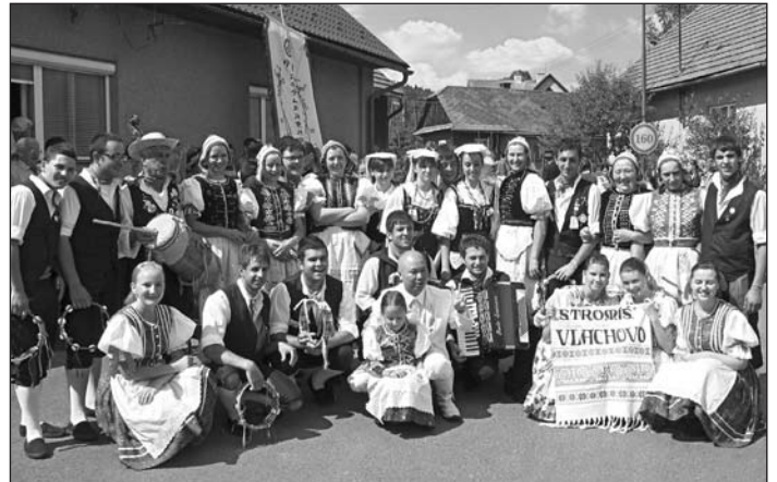
FS Stromiš a FS z Talianska na spoločnej fotografii z Liptála

Obec má záujem o zriadenie takej inštitúcie, akou je Klub dôchodcov. Ten má