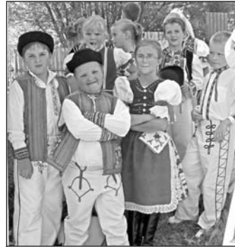
Z nedávnych škôlkarov sú dnes už veľkí súboristi...

V minulom školskom roku sme dosiahli dobré výsledky u detí využívaním prvkov prosociálnej výchovy a v rozvoji komunikačných schopností. Aj naďalej budeme v MŠ rozvíjať toleranciu, spolupatričnosť, zodpovednosť, vedieť vyjadriť svoje pocity, požiadať o pomoc, hovoriť o zlej skúsenosti, atď. Všetky problémy a bolesti riešime spoločne s deťmi v rannom kruhu , kde si navzájom pomáhame a poľujeme ranky na duši.