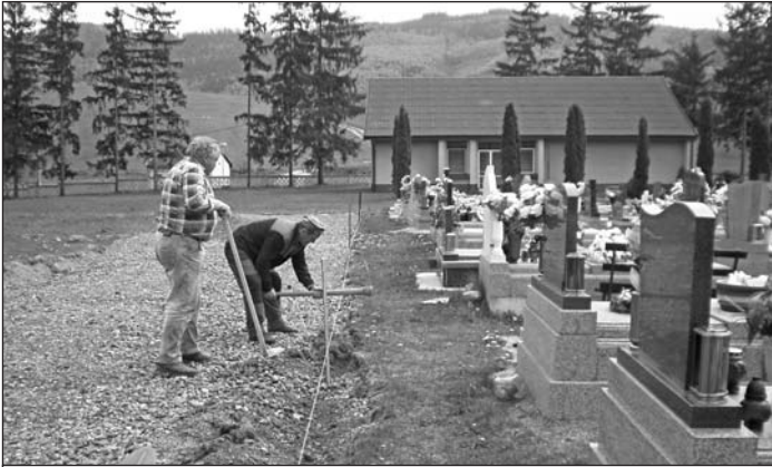
Pracovníci VPS pri výstavbe nového chodníka na cintoríne.