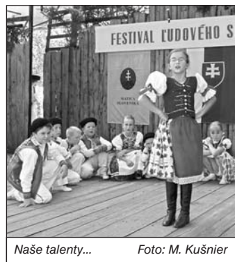
Naše talenty...

Prezraté z knihy Jána Šlosára, Vlachovo 1427-2002