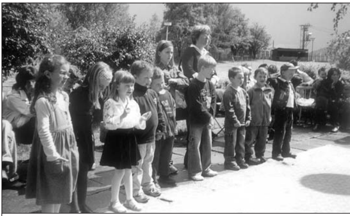
Naše najmenšie nádeje.