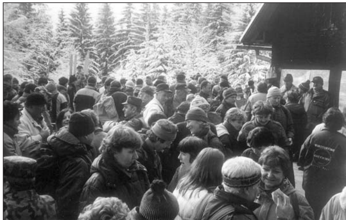
Na Stromiši pri chate v januári 2006.