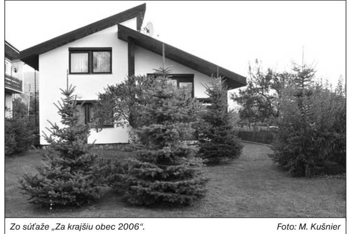
Zo súťaže „Za krajšiu obec 2006“.