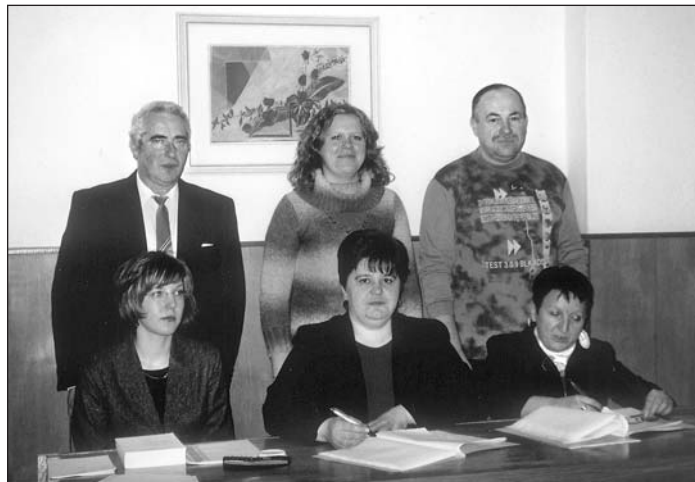
Miestna volebná komisia v komunálnych voľbách 2006.