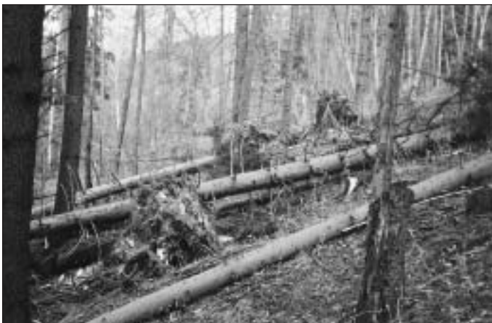
Lesná kalamita postihla aj zdroj našej pitnej vody na Polianke. Žiadali sme Lesy SR o náhradnú výsadbu lokality.

rekreácie, organizovalo im zájazdy do popredných družstiev alebo výlety do zahraničia, dokonca až do Bulharska na Zlaté piesky. Týmto sa upevňovali vzťahy v kolektíve, umožňoval sa oddych po celodennej práci a naberali sa nové sily v rámci zvyšovania kultúrnej úrovne ich života. Už pri jubilejných 10 rokoch existencie JRD sa začalo uvažovať o integrácii družstva, aby sa vytvoril väčší celok a to spojením JRD Vlachovo a príslušného JRD Gočovo. Na správu družstva bola zostavená náborová skupina členov, ktorí boli poverení, po dohode s predstavenstvom JRD Gočovo, aby s touto myšlienkou integrácie navštívili správu susedného družstva a predniesli našu požiadavku. Prvé rokovanie nebolo ešte úspešné, pretože boli rozdielne povinnosti členov voči družstvám vo Vlachove a Gočove. Dohodli sa však na riešení týchto rozdielov s príslušným, že otázka zlúčenia je aktuálnou a bude predložená na schválenie členských schôdzi oboch družstiev.