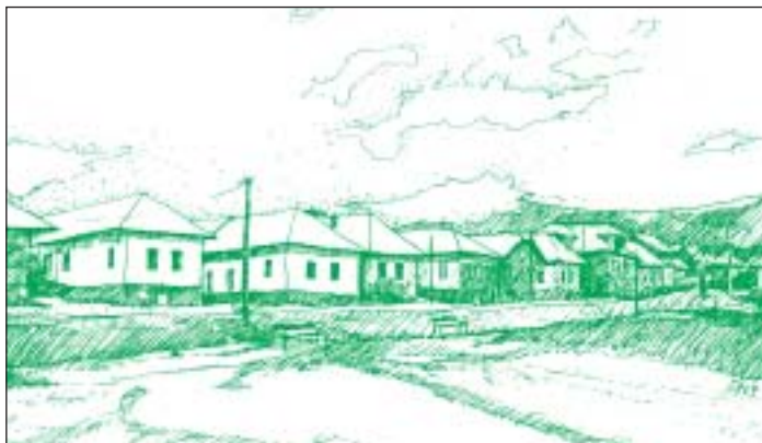
Obec Vlachovo si zachováva tradície, rozvíja zamestnanosť i agroturistiku. Pohľad na pôvodnú „potočnú“ zástavbu. Autorka kresby: S. Honětzová