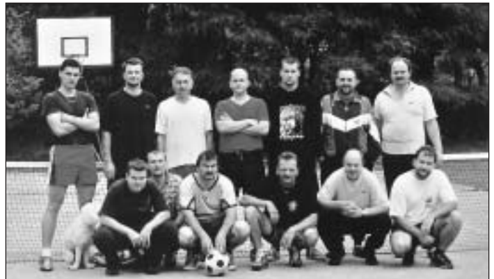
Účastníci nohejbalového turnaja na školskom ihrisku