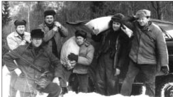
Členovia PZ prikrmujú zver v Riešici, r. 1987.

to smerom na Žliabky nad Gočovom. Po zotmení sa vracal domov okolo Odkaliska na Banské. Počul, že v hrabovom lese niečo šuchoce a mľaská. Zastal za šípkovým krikom, asi 20 metrov od lesa a čakal. Po chvíli z lesa vyšlo čosi veľké, tmavé a guľaté. Zobral veľký pozorovací ďalekohľad a sledoval zvera. Keďže už bola tma, nevedel ho rozoznať, no pozdávalo sa mu to na veľkého diviaka. Zver prišiel k nemu asi na 15 krokov a vtedy naň posvietil baterkou. Aké to bolo prekvapenie, keď sa pred neho postavil medveď. No hovorí, že sa nezľakol. Medveď sa v okamihu otočil a upaľoval do lesa, kde