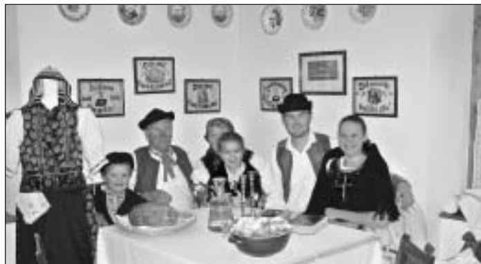
Na otvorení obecného múzea tvorili rodinku členovia folklórneho súboru Stromiš.