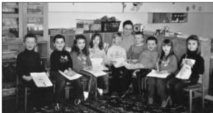
Deti MŠ na hodine angličtiny.