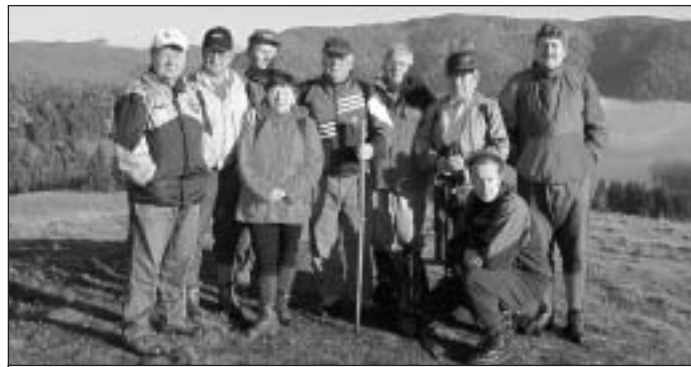
Účastníci „prieskumného“ turistického prechodu z Dobšinského kopca do Vlachova „Muzikantským chodníkom“ (k článku na 8. strane).