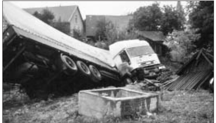
Havária rumunského kamióna pri št. ceste v októbri 2005. Obec žiadala riešenie bezpečnosti cesty petíciou. Za „obetu“ padla aj obecná studňa.