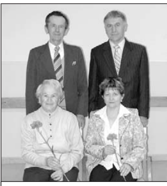
Riaditeľské rodiny našej školy (jkč)

Riaditeľka ZŠ poďakovala účastníkom podujatia, že prijali pozvanie organizátorov a ocenila všetkých bývalých riaditeľov, učiteľov a ostatných zamestnancov vlachovskej školy za zveľadovanie nielen jej priestorov, ale aj ľudských duší.