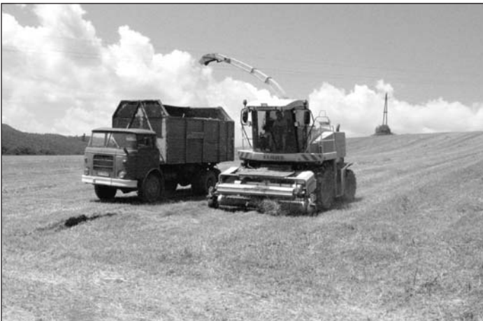
Naši družstevníci pri zbere zeleného krmiva v Doline.