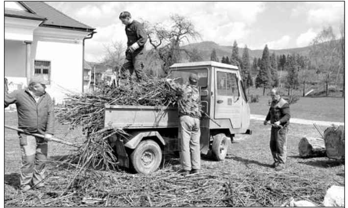
Pracovníci obce pri zveľadovaní životného prostredia.